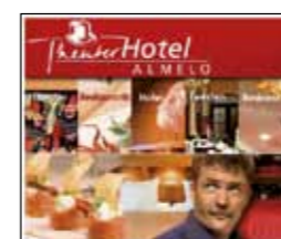
Rectangle (336x280 pixels)